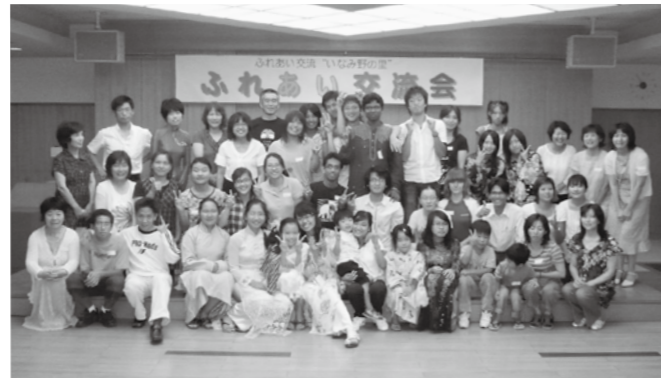
▲楽しい思い出がたくさんできますよ (昨年のふれあい交流会から)

稲美町国際交流協会では、今年も外国人留学生のホームステイ事業を実施します。今年の夏はいつもの我が家に異国の風を取り入れてみませんか?日本にいながら異文化交流することで、新鮮な気分になること間違いなしです。そして笑いあり、涙ありの忘れられない夏の思い出となることでしょう。皆様のご応募お待ちしております。