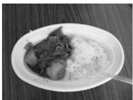
▲キムチチゲ&おにぎり ▲バングラデシュカレー