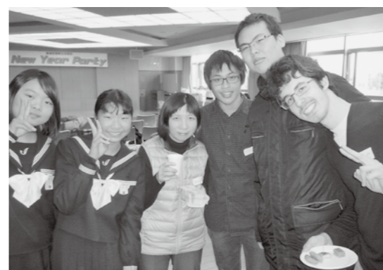
▲これが本当の国際交流