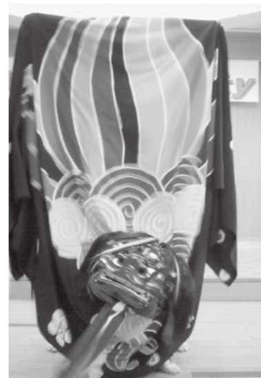
▲迫力のある獅子舞

琴と三味線のプレゼンテーションは素晴らしかった。もう一度稲美の景色を見て嬉しくなった。