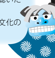
▲ちょっぴりおどけて