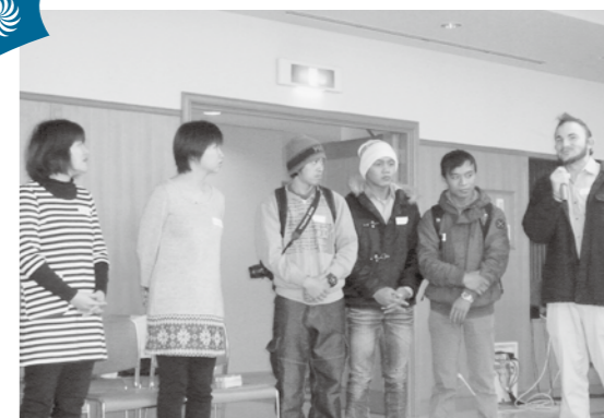
▲日本はいい国ですね