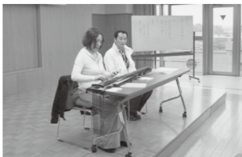
▲秋を感じさせる調べ

最後に、今、中国と日本は政治的に難しいですが、このような交流を通して、中国と日本の橋渡しができればいいなと思っています、と締めくくられました。