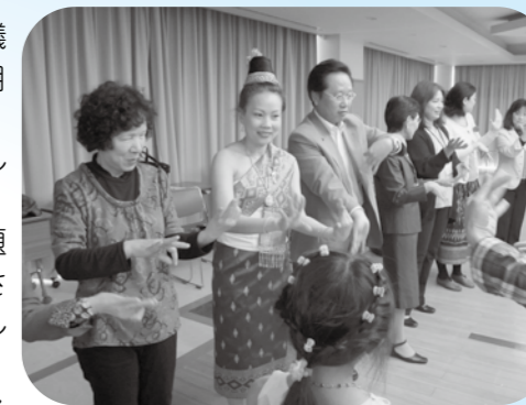
▲参加者全員でラオスの民族舞踊に挑戦

最後にお二人の指導で出席者一同祝賀行事の時に必ず踊るといふ民族舞踊に挑戦しました。手の動きの複雑さに皆四苦八苦しながらもラオスの異文化を体験する良い機会となりました。