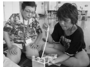
▲老人クラブとの交流(ぞうり作り)