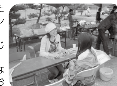
▲プレスレットうまくできたね