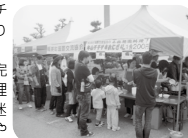
▲ピーク時には30名余りの列が...

稲美町国際交流協会では、食文化を通じて国際理解を深めていただけるように、「外国料理教室」や「ティーパーティ」など様々なイベントを企画してお待ちしております。