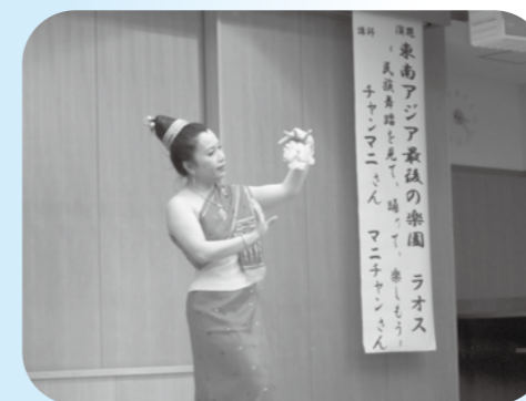
▲チャンマニさんの華麗な踊りに参加者もうっとり