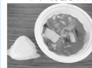
▲稲美町国際交流協会自慢のキムチチゲ&おにぎり

また、今年もフィリピンのプレスレットを販売し、準備していた30セットを完売しました。購入者は、それぞれオリジナルのプレスレットを熱心に製作していました。