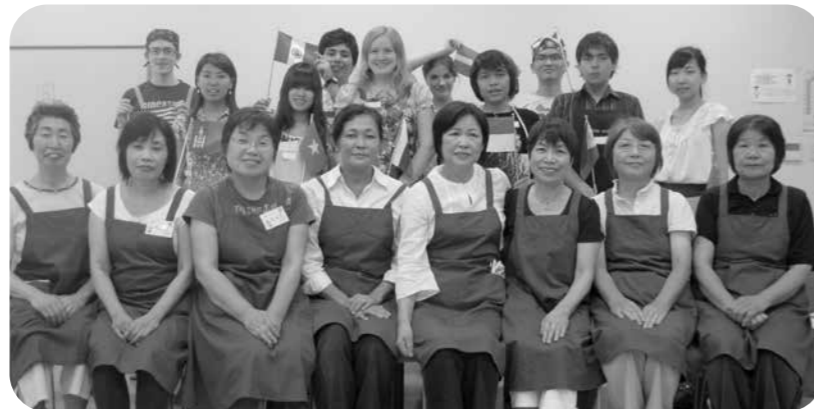
▲稲美ヘルスの会との交流（調理実習）