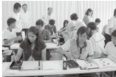
▲中学生交流～書道体験～