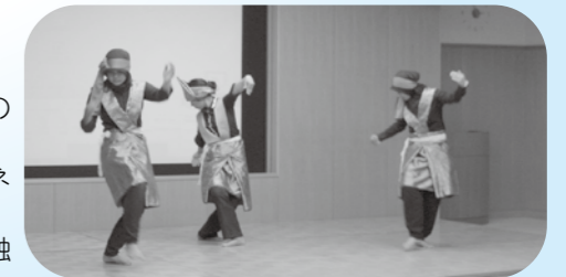
▲静かな力強さに感動