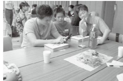
▲ふれあい交流～各国のクイズに挑戦～