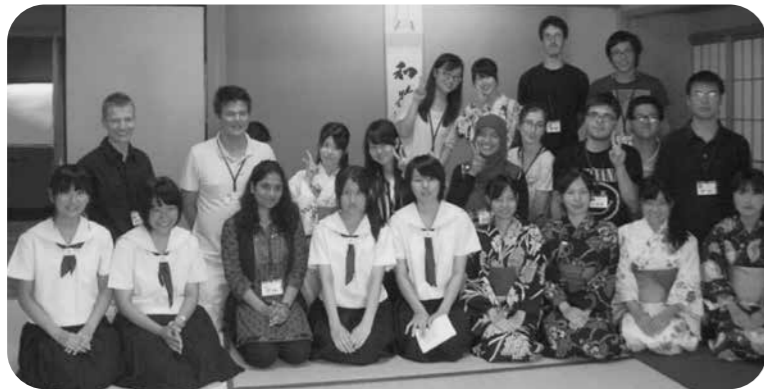
▲万葉茶会～高校生と日本文化を体験～