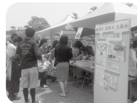
▲絶え間ない行列が…

看板から手作りしたパネルには協会の活動を紹介し、みなさんから寄贈された外国コインはアルバムで見えていただくという試みも始めました。みなさん、来年も来てくださいね！お待ちしております。