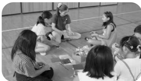
▲小学生交流～折り紙体験～

外国人留学生の多くは今年4月に来日しており、現在大学で日本語を勉強中です。彼らはホームステイを通して、日本語での会話や日本の生活・文化を肌で感じることを希望しています。ホストファミリーの皆様は、外国語が話せなくてもOK! 普段通りの生活に、家族の一員として受け入れていただく事をお願いいたします。