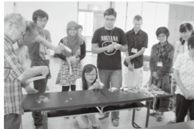
▲老人クラブ交流～昔遊び～